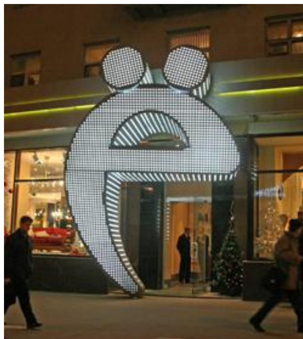
Памятник букве Ёё в Москве