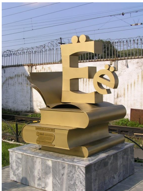
Памятник букве Ёё в Перми